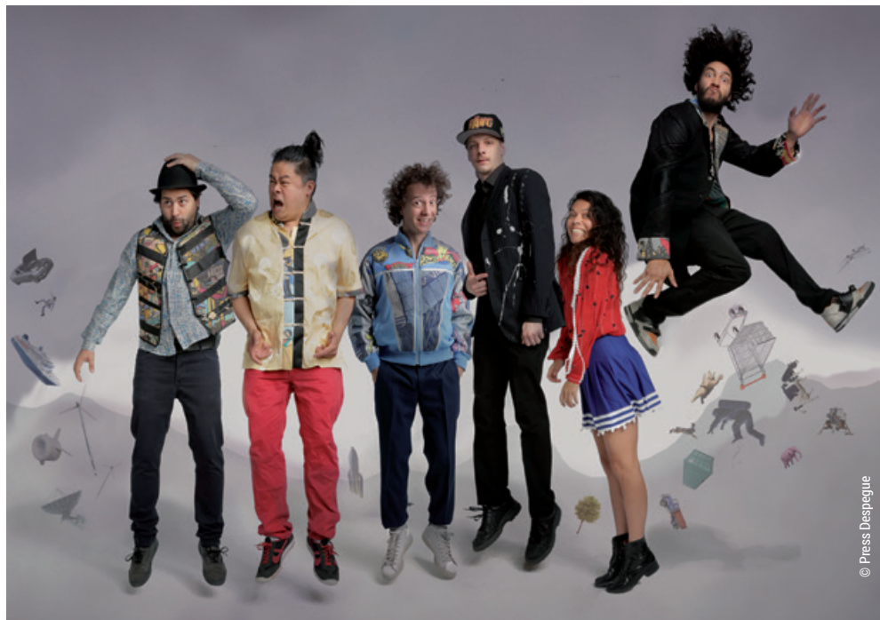
La Chiva Gantiva